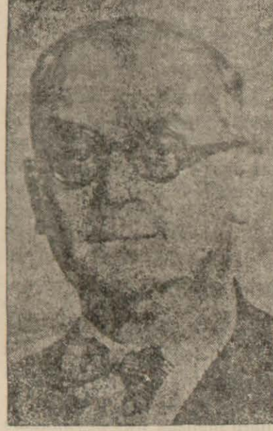
Başbakan B. Celâl Bayar

Kaplıcalar 25 (Radyo) — Kaplıcalarda bulunan Başbakan Bay Celâl Bayar dün İstanbul matbuat erkânına Termal otelinde bir öğle ziyafeti vermiştir.